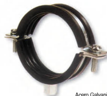
Acero Galvanizado y goma EPDM